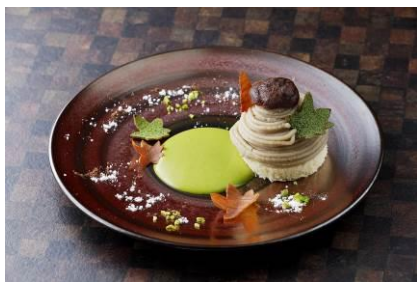
<ザ キッチン サルヴァトーレ クオモ>

【メニューの一部をご紹介します】 ※別途サービス料・席料等を頂戴する店舗がございます。※提供期間・時間、価格等は予告なく変更する場合がございます。