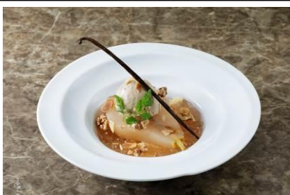
<ヴィノシティ マキシム 東京・日本橋>