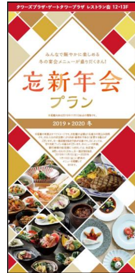
<忘新年会プランパンフレット>