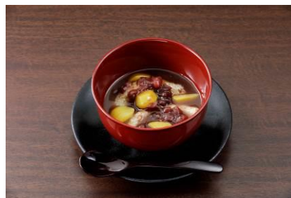
<江戸蕎麦 やぶそば>